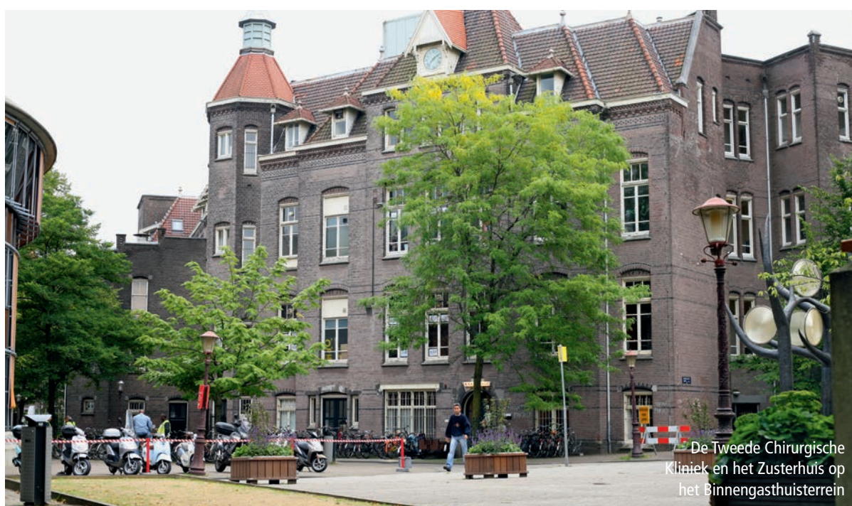
De Tweede Chirurgische Kliniek en het Zusterhuis op het Binnengasthuisterrein